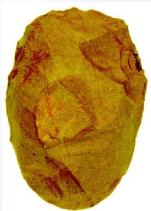
ARTEFATO (RASPADOR) LASCADO

As pesquisas de culturas arqueológicas no Vale do Rio Uruguai efetuadas pelo Programa Nacional de Pesquisas em Arqueologia (PRONAPA), assim como os trabalhos de Schmitz, nas décadas de 60 e 70, respectivamente, identificaram nesta área, algumas culturas pré-ceramistas, como: Humaitá e Umbu, entre outras; e culturas ceramistas como Taquara e Tupiguarani. Podemos, portanto, identificar dois períodos amplamente definidos para a área: o pré-cerâmico e o cerâmico, a exemplo do que ocorre em todo o Brasil.