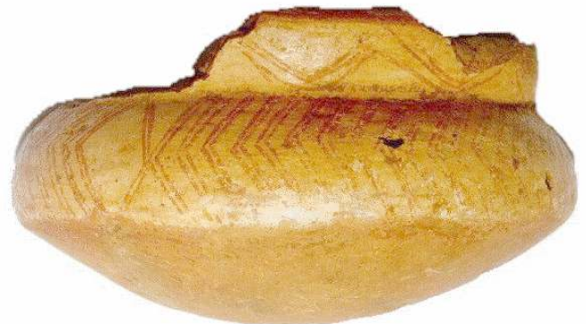
CERÂMICA PINTADA - GUARANI

Este período pré-histórico foi marcado por profundas transformações climáticas, que exigiu das populações humanas, novas soluções culturais. As transformações pós-pleistocênicas modificaram completamente as paisagens: o clima frio e seco glacial foi substituído por um clima quente e úmido; as paisagens vegetais dão lugar à cobertura vegetal mais densa e variada; a antiga megafauna desaparece levando os caçadores a um processo de readaptação e caça a animais de pequeno e médio porte. Essas transformações ecológicas foram acompanhadas pelas populações pré-históricas do Vale, provocando mudanças substanciais em seus modos de vida, o que é testemunhado pelos elementos da cultura material, principalmente lítico e cerâmico, deixados por grupos humanos nos sítios arqueológicos, locais das ocupações humanas pretéritas.