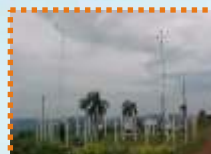
Estação Meteorológica de Itá