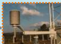
Sensor de temperatura e umidade relativa