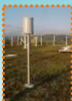
Pluviômetro digital ou tele-pluviômetro